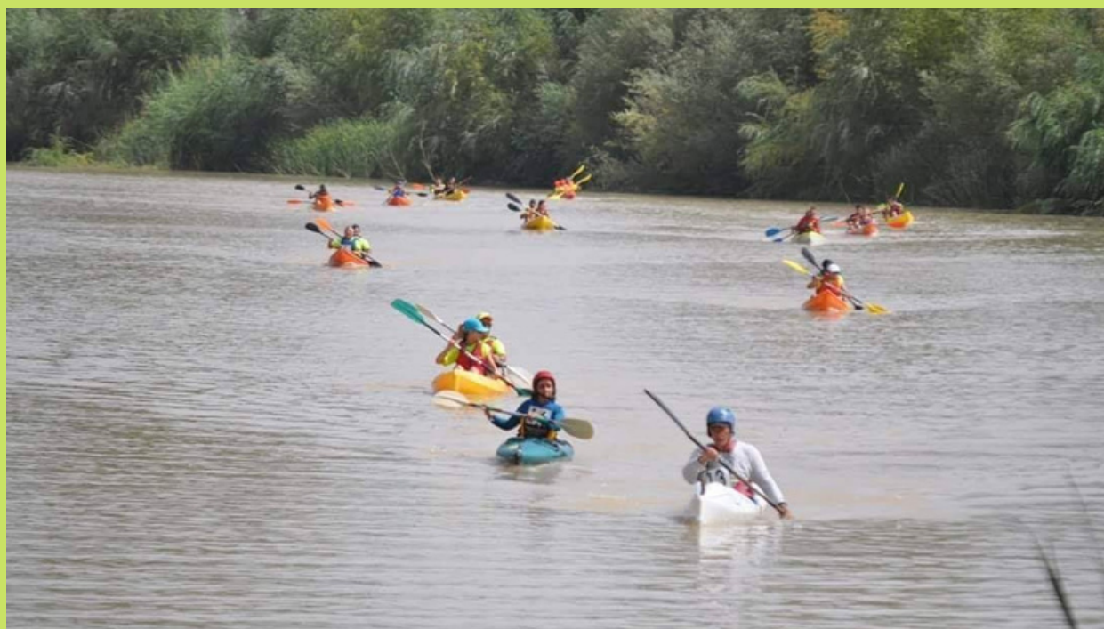
Actividades en el Río Guadalquivir