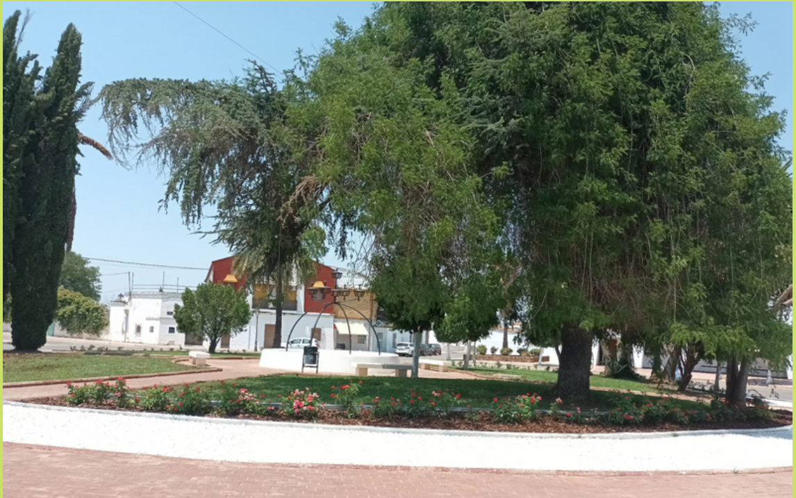
Plaza de la Constitución