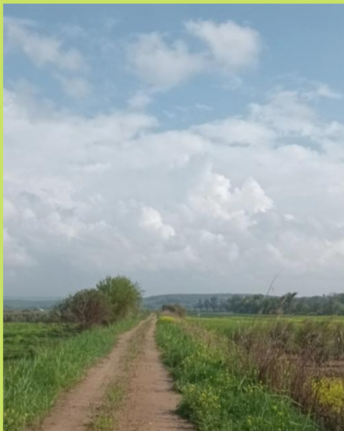
Caminos del sendero que discurren junto al río Guadalquivir