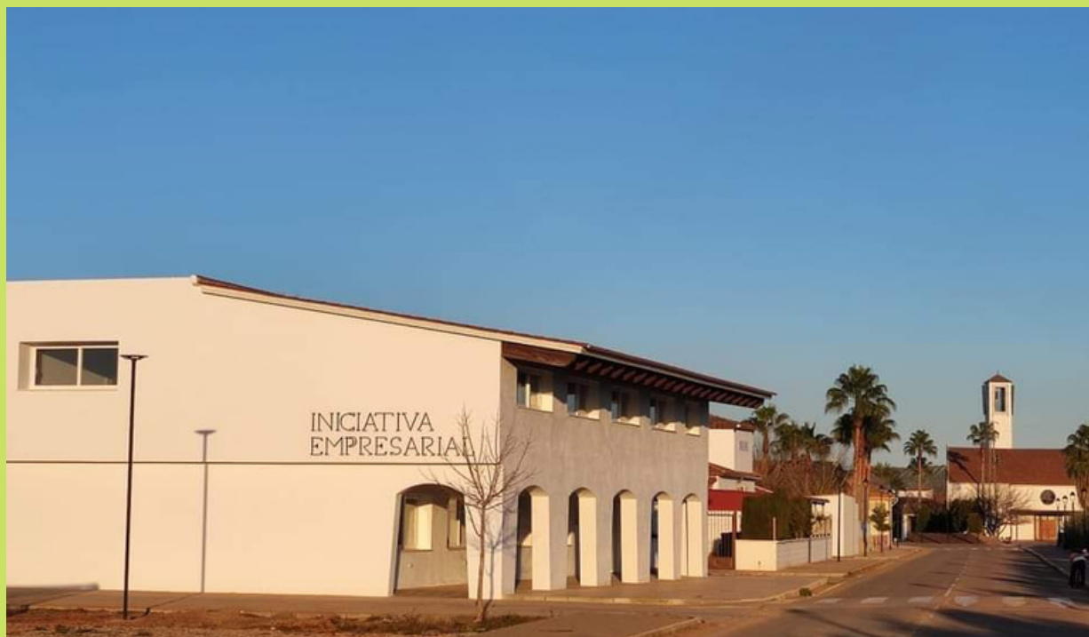
Edificio del Centro de Iniciativas Empresariales