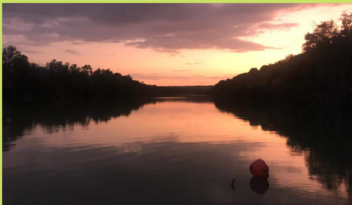
Río Guadalquivir. Zona del embarcadero de Algarrarín