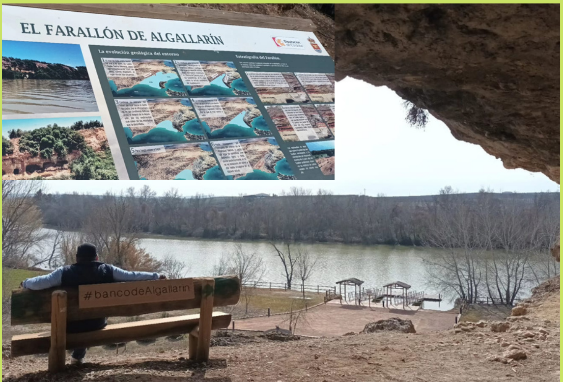
Vistas del embarcadero desde el Farallón de Algallarín